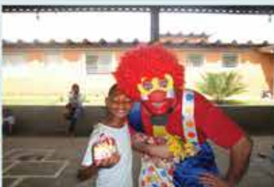
Visita alunos da Fatec