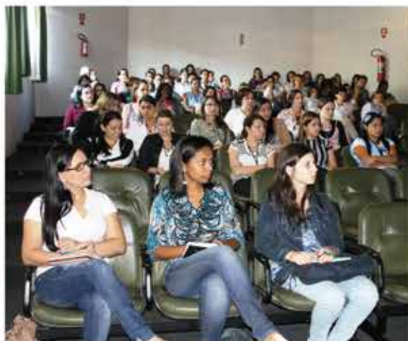
Público lotou o anfiteatro da Casa dos Médicos.