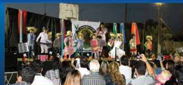
Escolas e empresas parceiras da APAE realizam na Entidade suas tradicionais festas juninas. pág 6