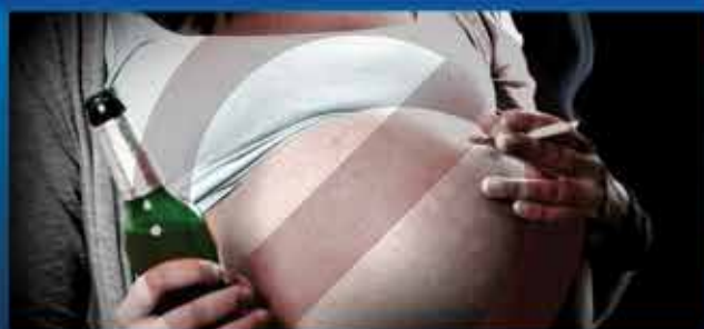
Equipe de Prevenção promove evento para alertar sobre os perigos do álcool na gravidez. pág 3