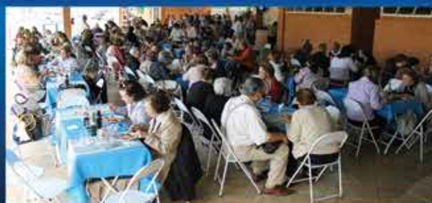
“Almoço entre amigas” das voluntárias da APAE é um grande sucesso. pág 5