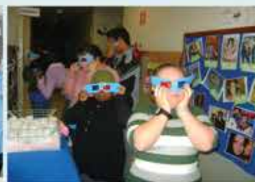
Projeto sobre cinema