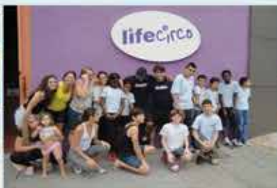
Aprendendo sobre circo